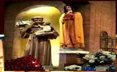
FOTO DE FAMILIA