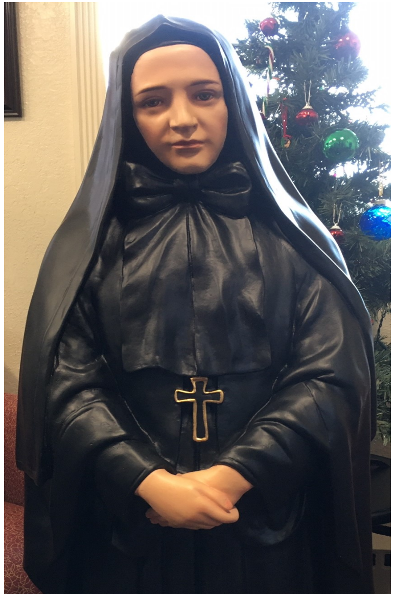
Santa Frances Xavier Cabrini, ella es una patrona de los inmigrantes italianos y, por extensión, Patrona de todos los inmigrantes

¡Gracias! Gràcies! Thank you! Merci! DANKE! 你很