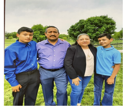
Familia Duran Año 2021