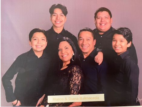
Familia Balmaceda Año 2019

GRACIAS A ESTAS FAMILIAS POR TODA SU LAVOR!!!